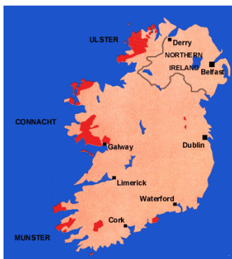
Le areas rubie sur le mappa signa le localisation del gaeltacht irlandese.

Ante tal panorama, inclusive le Fina Gael, partito nationalista fundate per Michael Collins, ha proposit que se elimina su character obligatori in le schola, ubi, on assecura, illo se ha converse in un subjecto antipathic.